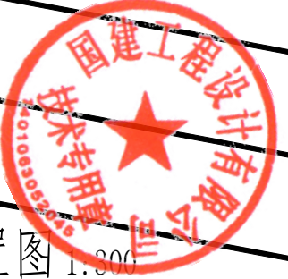
天津市公安局交警大队业务技术用房建设项目总体平面布置图