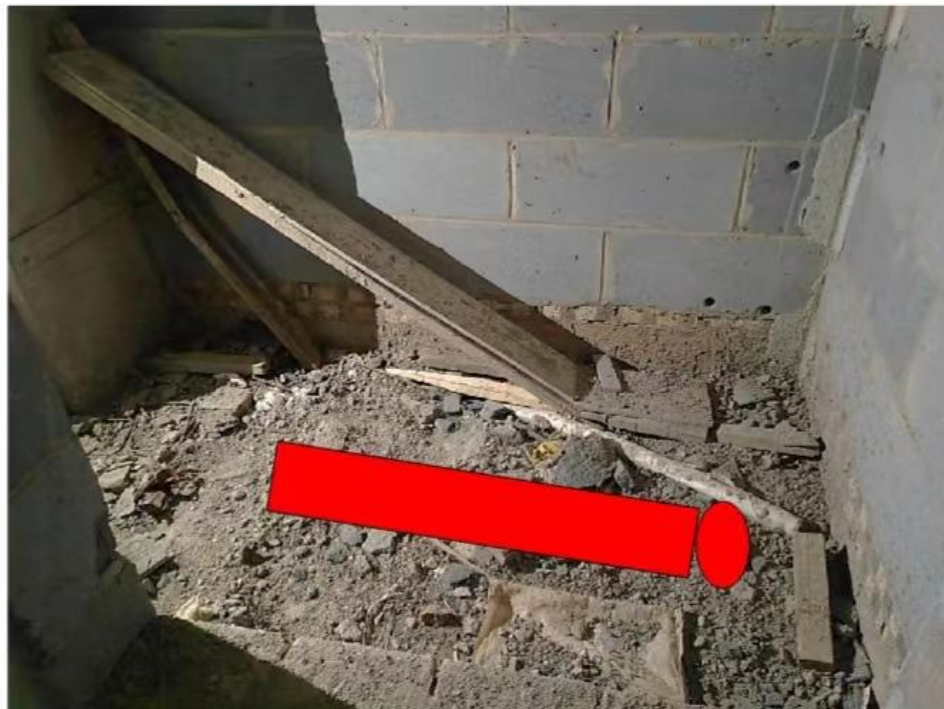
图4 人员坠落地点示意图