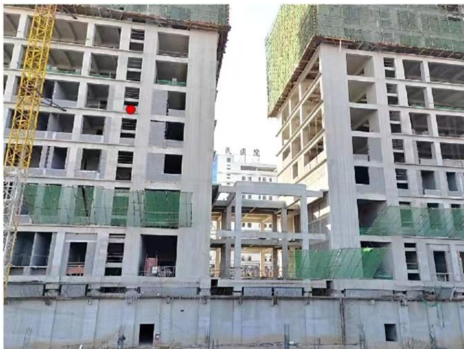
图 1 事故发生位置