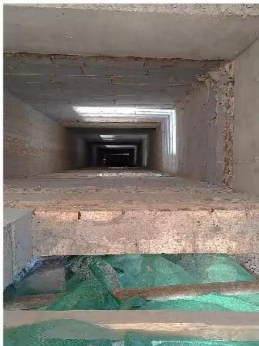
图3 通风井俯视图（5层平台）